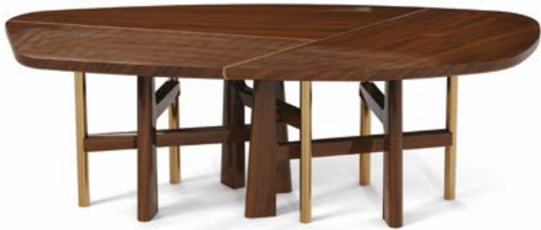
Glossy varnish-finished veneered Macassar ebony wood / patinated brass Placage d'ébène de Macassar, vernis brillant / laiton patiné 2300 x 1080 x 750h mm