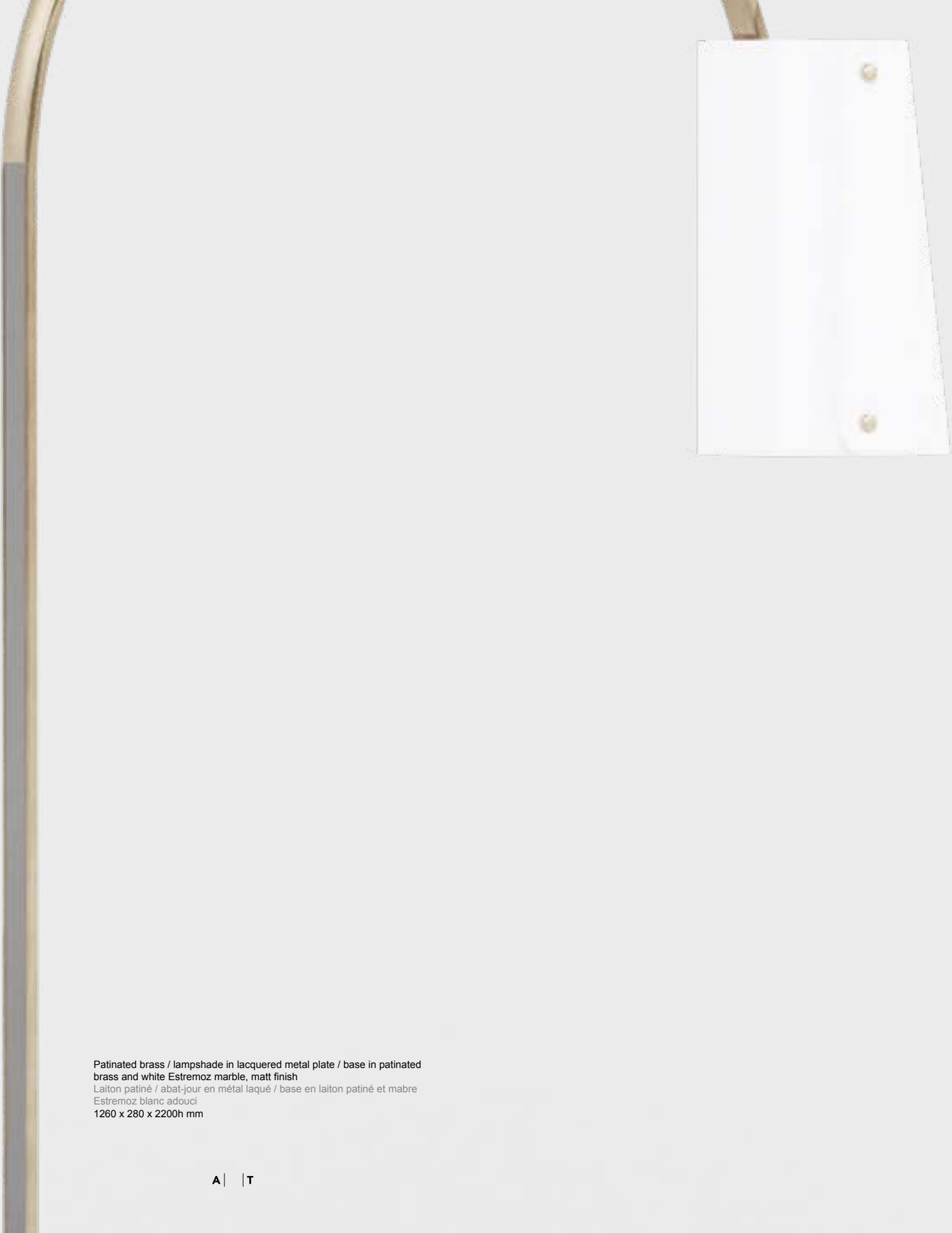
Patinated brass / lampshade in lacquered metal plate / base in patinated brass and white Estremoz marble, matt finish Laiton patiné / abat-jour en métal laqué / base en laiton patiné et marbre Estremoz blanc adouci 1260 x 280 x 2200h mm