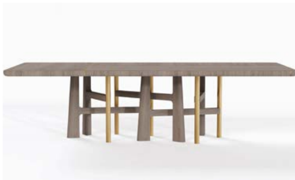
Silver grey stained solid and veneered oak, matt varnish-finished / patinated brass Chêne massif et plaqué teinté gris argent, vernis mat / laiton patiné 2600 x 1200 x 750h mm